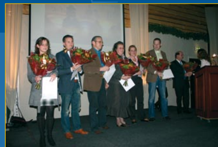
De gelukkige winnaars van de rondvlucht boven de Koewei tijdens de 25e Ballonfiësta

Verder in deze nieuwsbrief kunt u meer lezen over deze uitermate geslaagde sponsoravond.