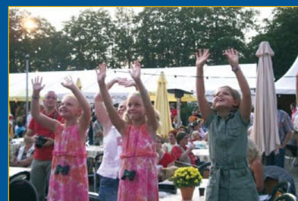
Kinderen zwaaien naar de vertrekkende ballonnen