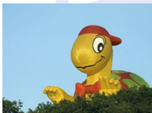
Nr 2: André Dorst Elspeet